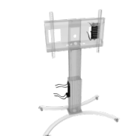
Universalhalterung für PCs