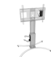
Universalhalterung für PCs