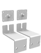
2 verzinkte Wandhalterungen