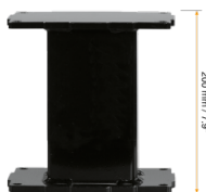
Extender für Aluminiumhubsäulen