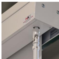
Kurbelantrieb - links