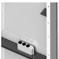
Zubehör - "3fach Steckdosenleiste, 5 m Kabel abnehmbar"