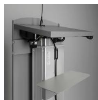
Zubehör Ablage zur Montage an der Säule - "Rednerpult-S"