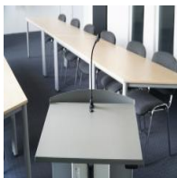
Zubehör Rednerpult - "Ausschnitt für Schwanenhalsmikrofon"