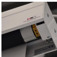
Motorantrieb - links