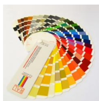
Sonderlackierung des Rahmens Brillant