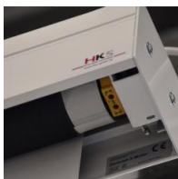
Motorantrieb - links