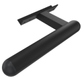
Griff zur Bedienung