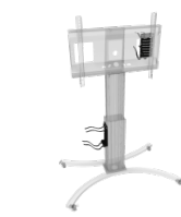
Universalhalterung für PCs