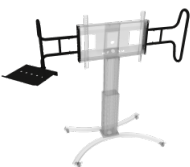
Zwei große, stabile Griffe inklusive Laptop-Ablage