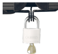
Halterungen und Flügelschloss