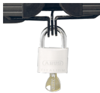
Halterungen und Flügelschloss