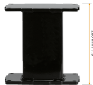
Extender für Aluminiumhubsäulen