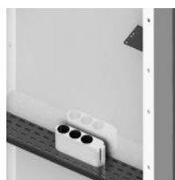
Zubehör - "3fach Steckdosenleiste, 5 m Kabel abnehmbar"