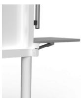
Zubehör - "VST-MS Seitenablage, klappbar"