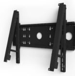
LCD Halterung - Surface Hub 25 85"