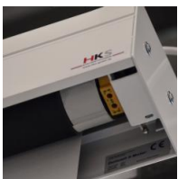
Motorantrieb - links