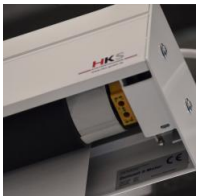
Motorantrieb - links