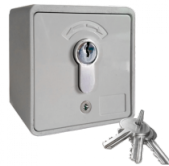
Schlüsselschalter auf Putz für Congress-S

Funkfernsteuerung - extern - mit 1-Kanal Handsender (Congress-S)