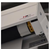
Motorantrieb - links