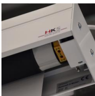
Motorantrieb - links