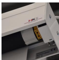
Motorantrieb - links