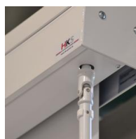
Kurbelantrieb - links