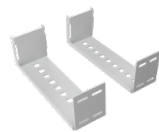
Wandabstandshalter 20 cm (für Dolomit II / Scala II)