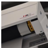
Motorantrieb - links