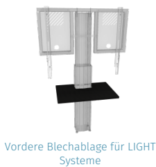
Vordere Blechablage für LIGHT Systeme