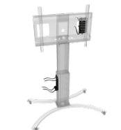
Universalhalterung für PCs