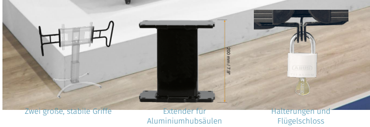
Zwei große, stabile Griffe