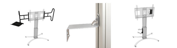
Zwei große, stabile Griffe inklusive Laptop-Ablage