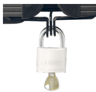
Halterungen und Flügelschloss